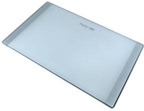
Schneidebrett aus Glas 8633 300