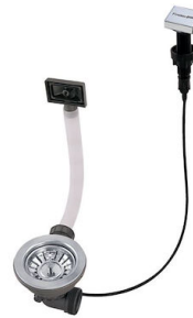
Automatischer Abfluss LIRA 8407 102