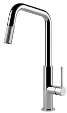
Mischbatterie KS Plus 8522 000