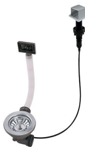
Automatischer Abfluss LIRA 8407 103